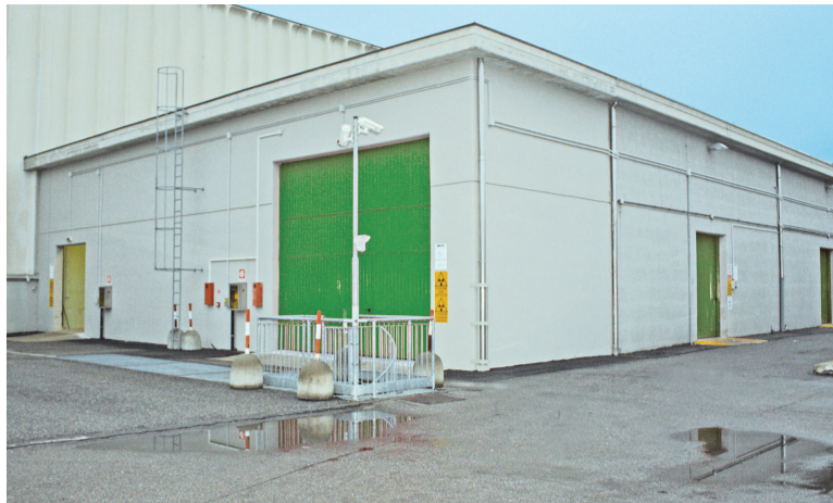
Nel 2013 MIT Safetrans ha ampliato la struttura per la gestione dei Dangerous Goods (bunker RRY) all'interno del sito autorizzato di Carugate (MI)

della società sono state rivolte in prevalenza alla coltivazione di un know how altamente specializzato che, da solo, agisce come motore di crescita del business. E così è stato: grazie al passaparola, la società ha trovato una posizione sul mercato con un proprio definito raggio di azione, stringendo collaborazioni con clienti caratterizzati da esigenze molto specifiche in termini di movimentazione e gestione logistica particolare. Questo almeno fino al 2004, quando la società di Carugate è protagonista di una vera e propria svolta. Non certo nell'orientamento al business, infatti non è mai stata messa in discussione la sua caratterizzazione come operatore di nicchia, bensì nella composizione societaria, caratterizzata dalla permanenza di